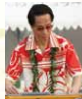
「よせばいいのに」 でおなじみの 作詞作曲家三浦弘